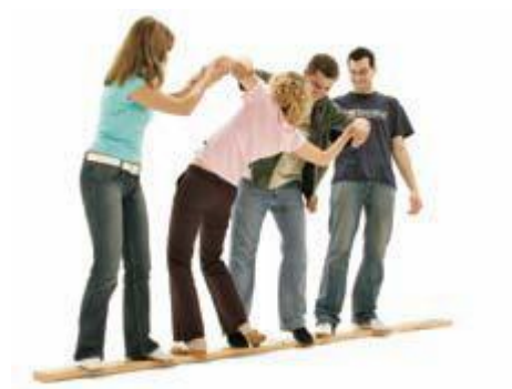
Lern-Transfer mit Kommunikation und Spaß auf dem Teambalken

Auf Wunsch sind wir Ihnen bei der Durchführung und Nachbereitung einzelner Tools behilflich. Sprechen Sie uns einfach an!